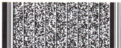
Timbre electrónico SRCel

Verifique documento en www.registrocivil.gob.cl o a nuestro Call Center 600 370 2000, para teléfonos fijos y celulares. La próxima vez, obtén este certificado en www.registrocivil.gob.cl .